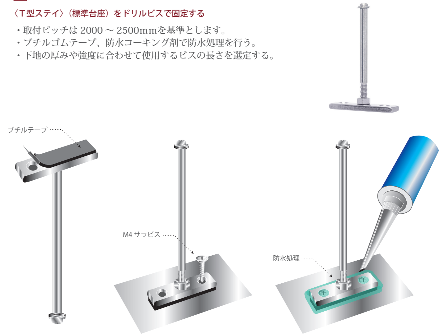
台座の裏にブチルテープを貼る M4 サラビスでステイを設置する コーキング剤で防水処理を行う