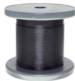
〈トリカットコーティングワイヤー〉 ワイヤー：SUS304 被膜：ナイロンコーティング 1 巻 (200m)