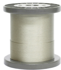
〈トリカットワイヤー SUS316〉 SUS316/1 巻 (200m)