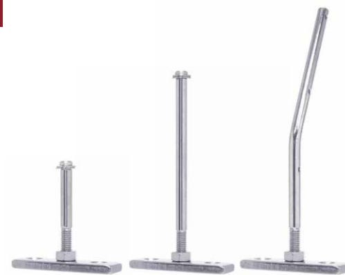
〈T型スティシリーズ〉