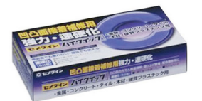
〈ハイクイック接着剤〉