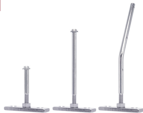
〈T型スティシリーズ〉