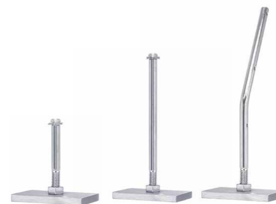
〈T型スティ接着台座シリーズ〉